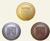
Landwirtschaftskammer Rheinland-Pfalz Kammerpreismünze