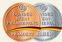
DLG Bundesweinprämierung Großer Preis

Auch bei der Teilnahme an der Bundesweinprämierung (DLG) wurden unsere Weine hoch prämiert und in die Gruppe der deutschen Spitzenweine eingeordnet.